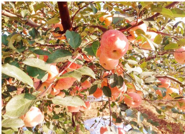
家乡的苹果俏挂枝头

我爱秋天不仅是因为她景色的优美，而且还是因为她让种子变成了果实，完成了对生命的诠释。真的是被这金秋感染了，陶醉了。