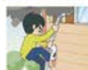
缓降逃生 不贪不恋