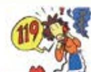
发现火情 报警要早