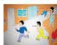
慎入电梯 改走楼梯