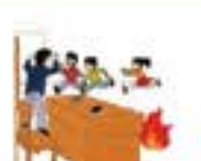
保持镇定 有序外逃