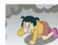
简易防护 匍匐弯腰