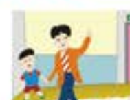
熟悉环境 出口易找