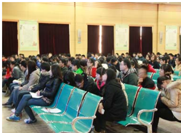
200 多名学生到场参加本次双选会