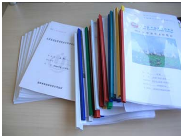
挑选的学生简历及三方协议