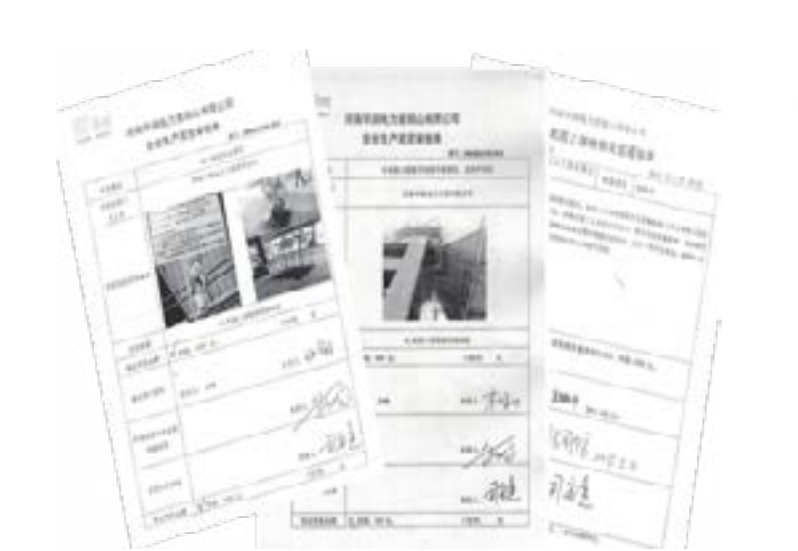
图 1：三次现金奖励单

中能公司检修业务实行标准化管理以来，不论是核心的运维检修基地还是承接的短期检修项目，均不断获得各业主方肯定。这表示中能公司的管理创新模式取得了一定成功。公司将再接再厉，励志将运维检修版块模式打造成行业标杆。