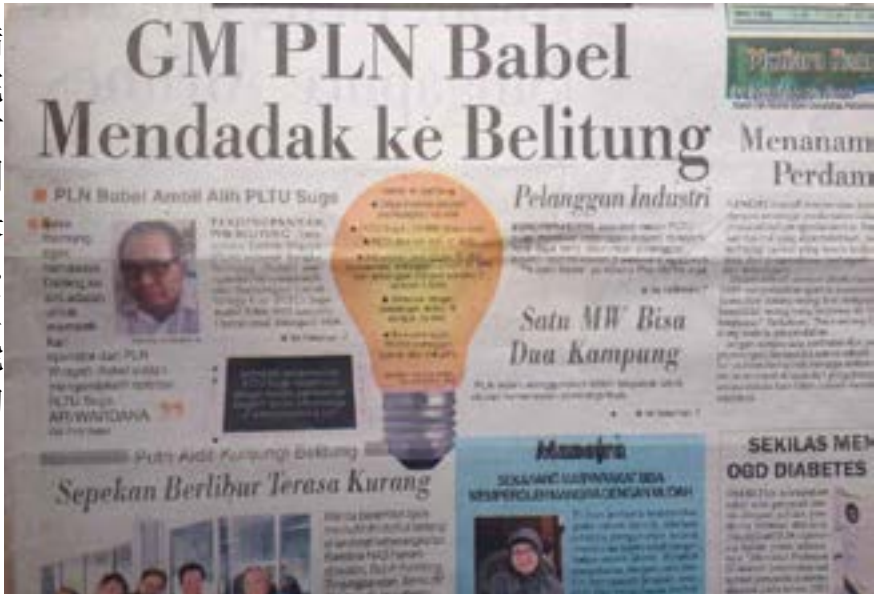
勿里洞邮报的刊文报道

经过连续 3 天的奋战，终于圆满地完成了各项试验，性能指标完全符合设计和业主要求，目前机组已移交生产。从此，勿里洞岛上的居民终于告别了电力短缺的时代。公司自入驻印尼市场以来，多次获得赞誉，已在该地区形成了良好的市场口碑，为中能公司发展国际市场奠定了坚实的基础。