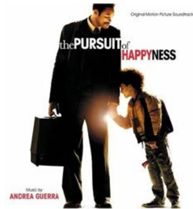
电影名称：当幸福来敲门 主演：威尔·史密斯

【剧情简介】已近而立之年的克里斯·加德纳（威尔·史密斯），是一名普普通通的医疗器械推销员。这种不安定的生活已经影响到家庭的和睦，最终妻子琳达忍受不了经济上的压力，离开了克里斯，留下他和 5 岁的儿子克里斯托夫相依为命。这时候克斯银行帐户里只剩下 21 块钱，因为没钱付房租，他和儿子被撵出了公寓。