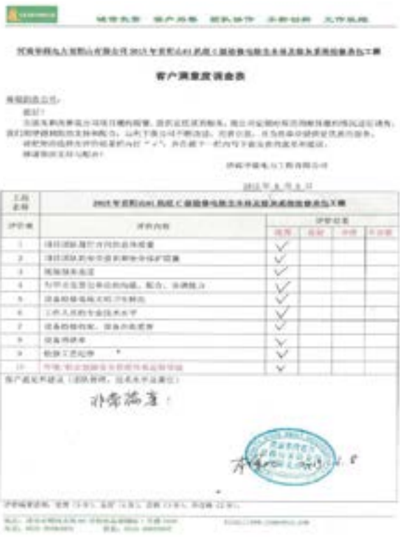
图 2：客户满意度调查表

2015年5月，公司择优挑选了一批人员参加由中国电力建设企业协会组织的调总及调试工程师培训考试。6月15日得到确切信息，我公司所有人员均顺利通过考试。