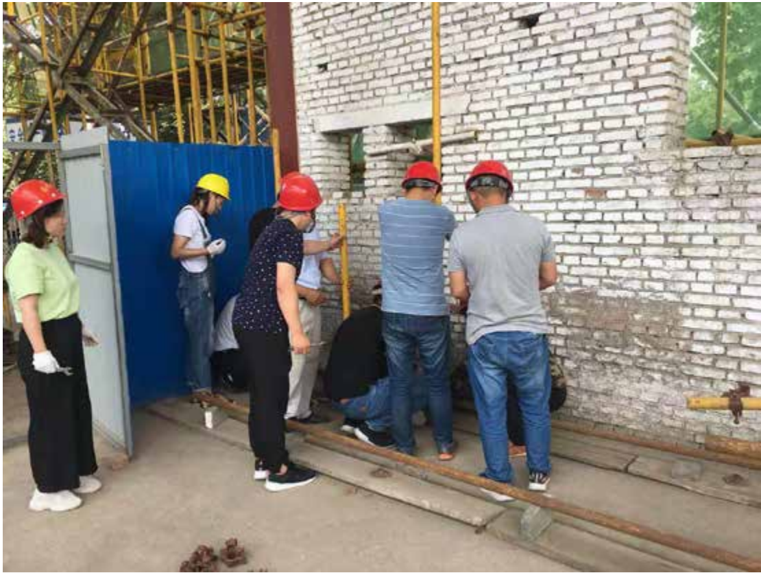
特殊工种—架子工现场实操考试