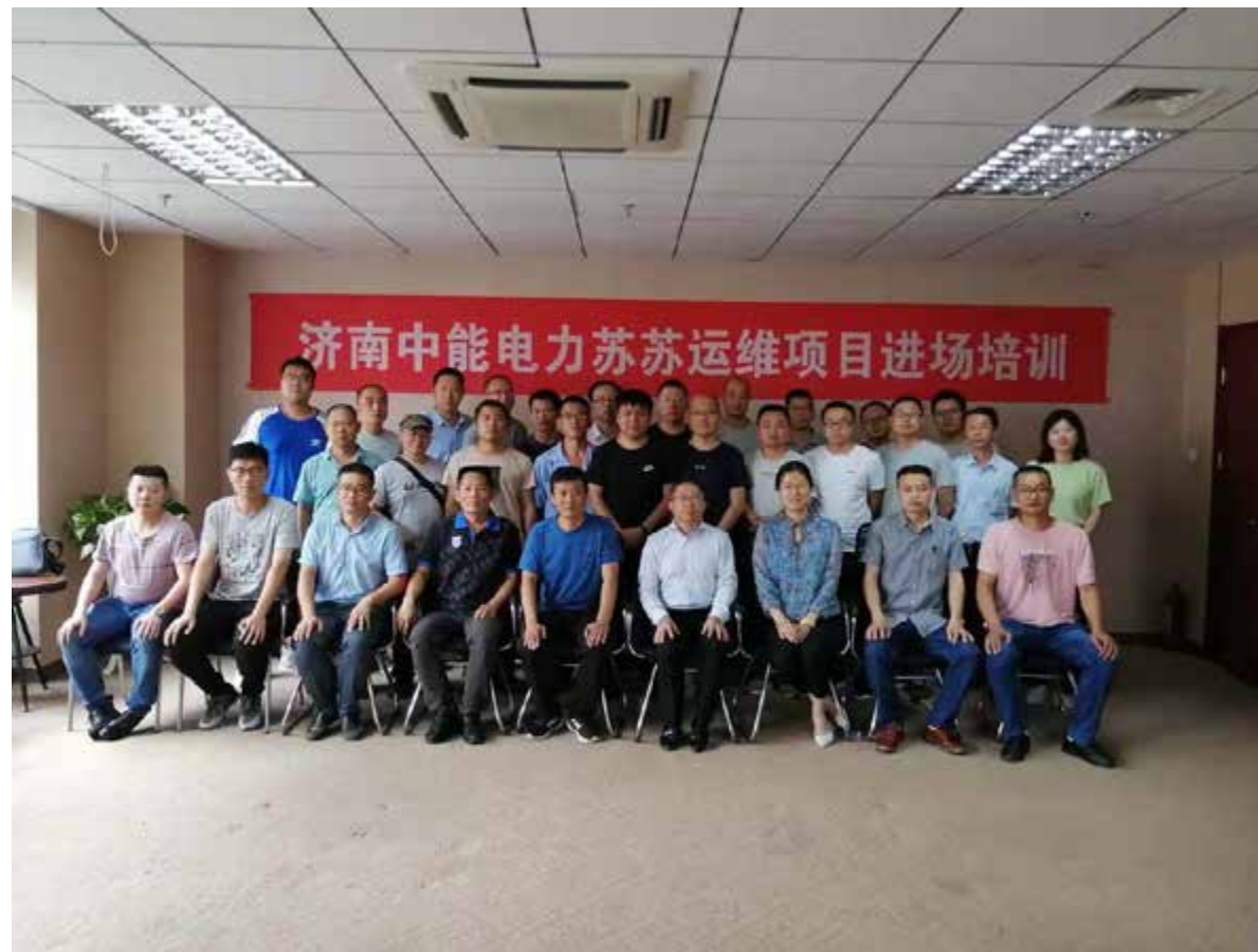
第一批员工合影留念