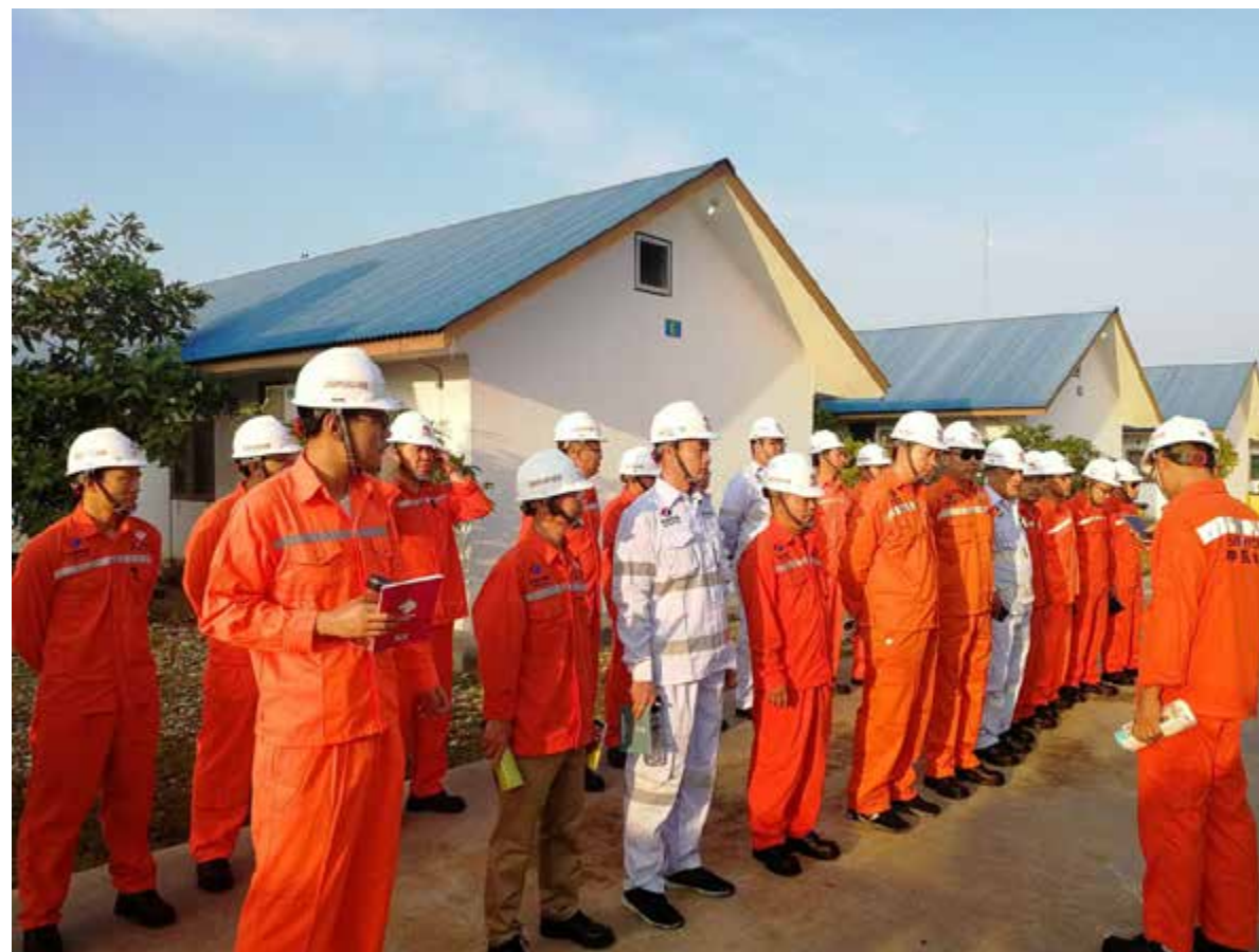
第一批员工迅速进入工作角色