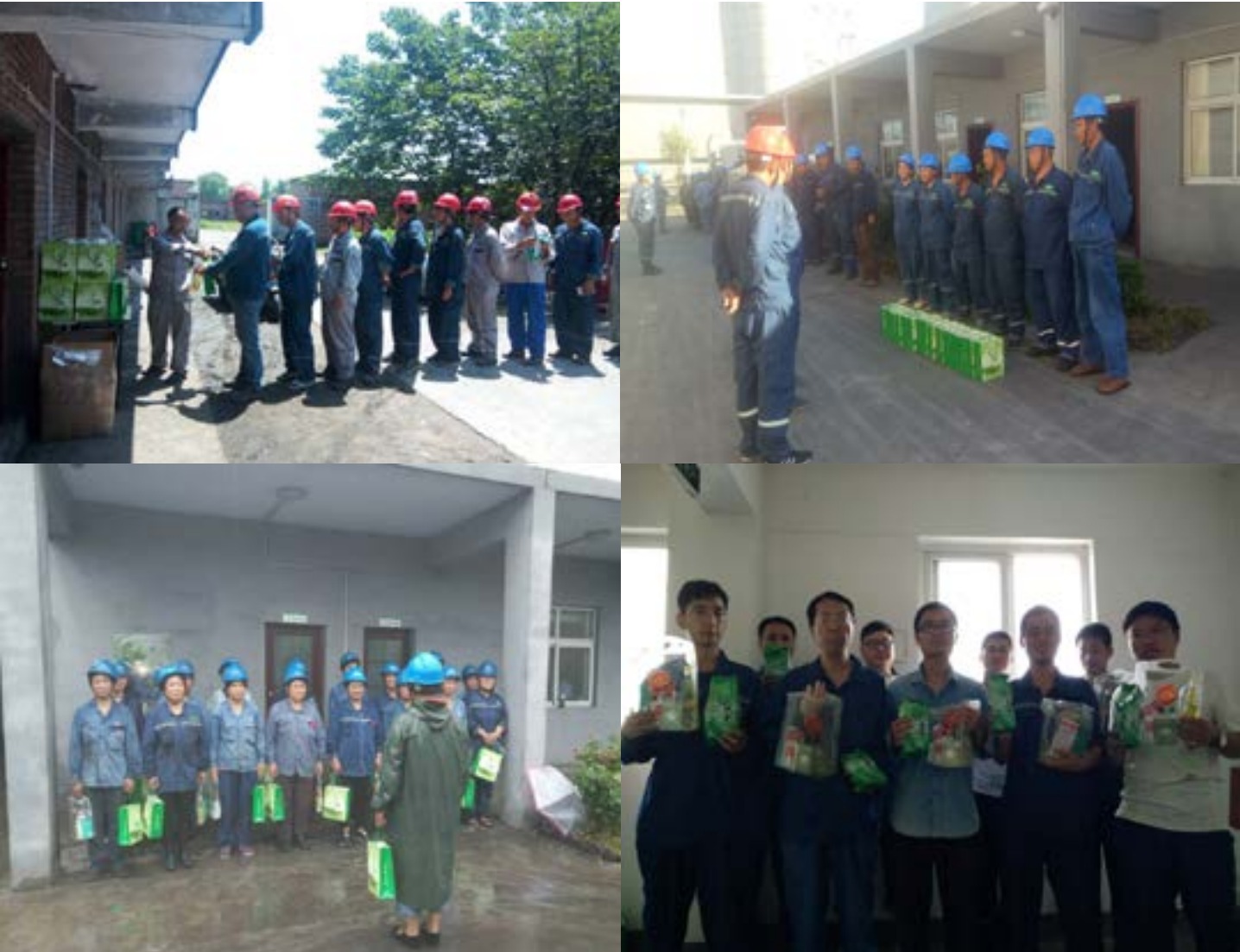
各项目部员工领取现场

进入夏季，公司领导高度重视员工防暑降温工作，亲自到项目部慰问员工，并安排人力资源部、综合部组织落实防暑降温礼品的采购和发放工作，要求安全部门加强相关安全知识的培训和宣传力度；各项目部负责人已确保防暑降温礼品发放到位，保证高温天气下安全作业，有效合理安排工作，防止、杜绝作业人员中暑和职业卫生事故的发生，确保现场人员生命安全和工作秩序。