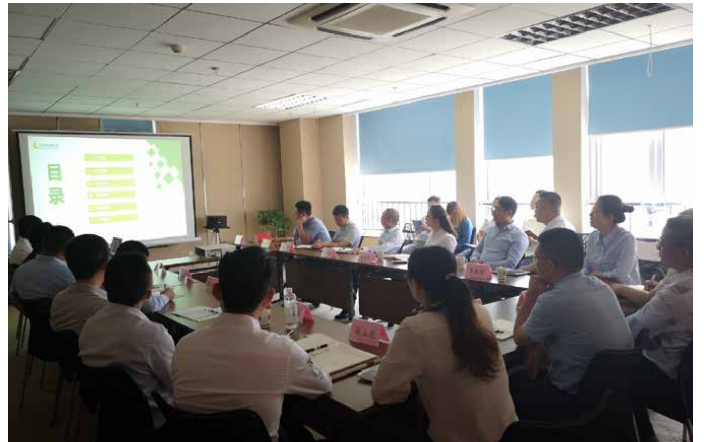
各部门负责人做总结汇报