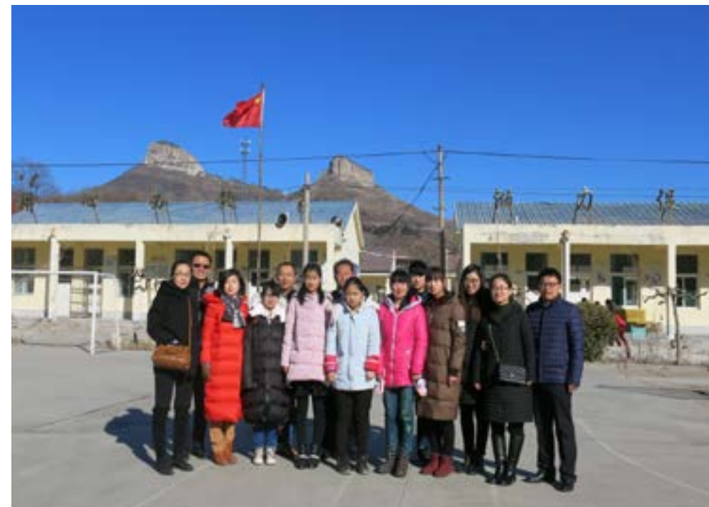
公司人员、校长与孩子们合影