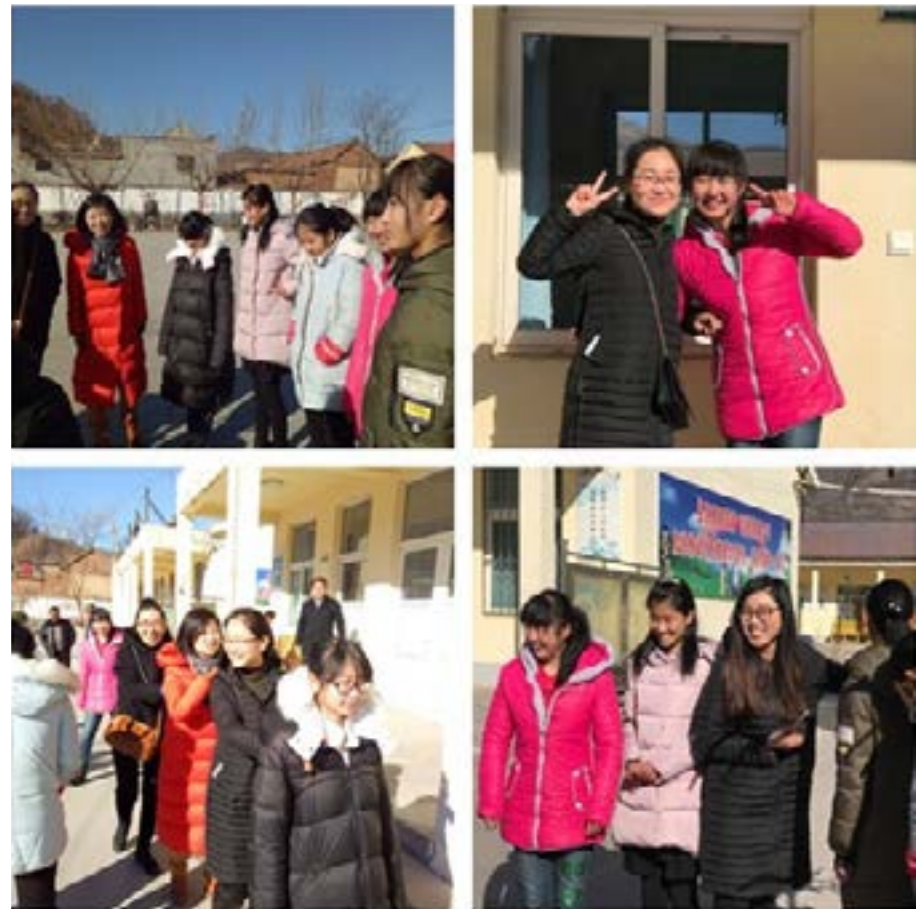
与孩子们聊天、玩耍