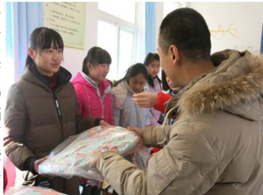
为孩子们发礼物和助学金

公司每年举行寒暑假两次资助活动，慈善基金由中能公司董事长、总经理及全体员工的爱心汇聚而成，专款专用。2017 年春节一过，公司携带着助学金和礼物又来到了章丘官营小学探望孩子们，刚进入校园，张校长、孩子们和家长就热情的迎了出来，经过几年的相识，无论是公司人员，还是校方领导，抑或孩子们，俨然是老朋友相见，互相之间都感到熟悉和亲切。仅半年未见，孩子们都长高长大许多，公司详细了解了孩子们今年的学习情况，也欣喜地看到随着成长，孩子们的性格变得阳光开朗，希望好好学习，快乐成长。张校长一再叮嘱他们要心怀感恩，成长为对社会有用的人。公司随后把助学金和书包、礼物分发到家长和孩子们手里，家长们都很感动，攥着公司人员的手紧紧不放。公司员工与孩子们自由交流，畅怀玩耍，分享快乐。随后，大家怀着不舍的心情乘车返回，期待暑假再见。