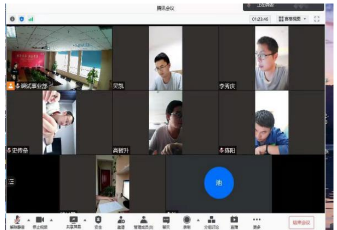
(热控专业考试中画面图)