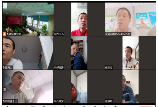
(汽机专业考试中画面图)