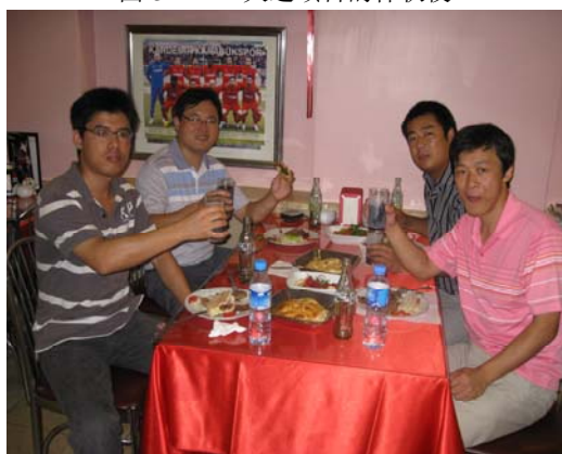
图4 土耳其项目的仲秋夜