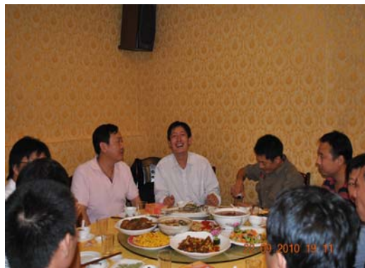
图 1 柳州项目的中秋夜

远在世界各地的中能人，正是因为有了大家这份坚守的信念和努力的工作，中能公司才一步步取得了可喜的成绩，我们中能的大家庭才得以越来越强大，同在一轮圆月下，让我们远隔千里共同庆贺那份特殊的团圆，祝愿中能的明天更加辉煌，祝愿所有的中能人及我们的家人快乐幸福！