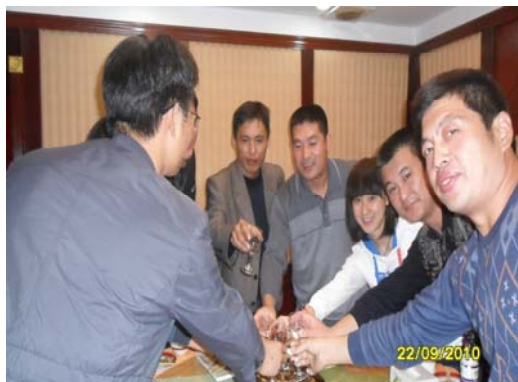
图3 大连项目的仲秋夜