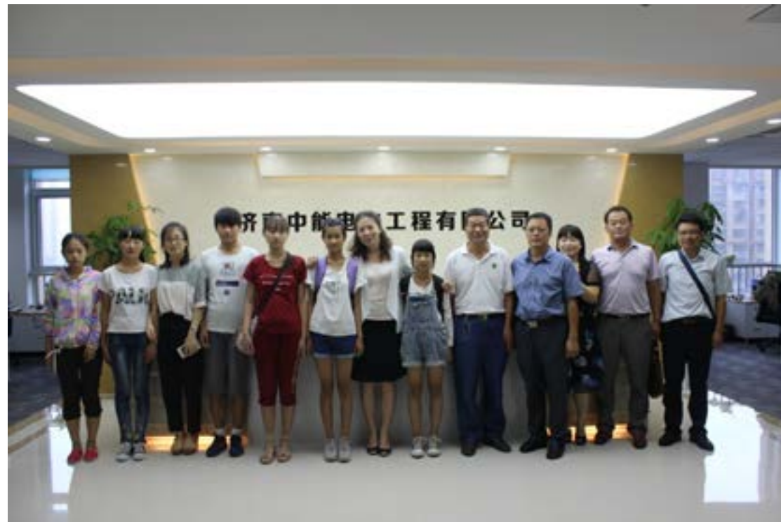
中能、中实易通与校长、孩子们合影

目前，孩子们都已开始新学期的学习和生活，最小的孩子也已升入初中。与孩子们六年的相伴，看到孩子们茁壮健康的成长，对此付出每一份力量的中能人表示：我们不求回报，只希望孩子们在成长的道路上能少一些坎坷，多一份真情，茁壮健康成长，将来做一个对社会有贡献的人。