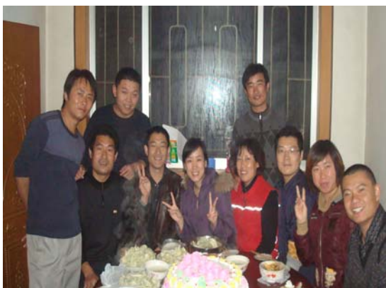
与栖霞同事们的合影

时间过得飞快，再有一天我就要踏上返程的列车了，吹管工作也即将完成，大家终于可以稍稍的松一口气，准备着下一个重要里程碑的工作。在大家的共同建议下，我们准备包水饺庆祝一下，大家都很开心也很期待，我的心里却有些小失落，因为那天是我的生日，这是我第一次在异地过没有家人陪伴的生日，家人一早就电话送来了祝福，这时细心的同事们得知是我的生日，大家都没有什么特别的表现，我也没有多想，到了晚上热气腾腾的水饺端上了餐桌，惊喜就从王工推开大门的一瞬间到来了，一个全是玫瑰花的生日蛋糕呈现在我的面前，大家好像商量好的，关灯点蜡烛，生日歌，此时的我完全惊呆了，感动的眼泪在眼里不停打转。大家让我许个愿，我许下“祝福我在中能的每一天都这样快乐”的愿望。在此，我要真心的谢谢栖霞项目部的所有同事，你们送给了我一个与众不同、终身难忘的生日，也让我在第一次的项目生活留下了最美好的回忆。