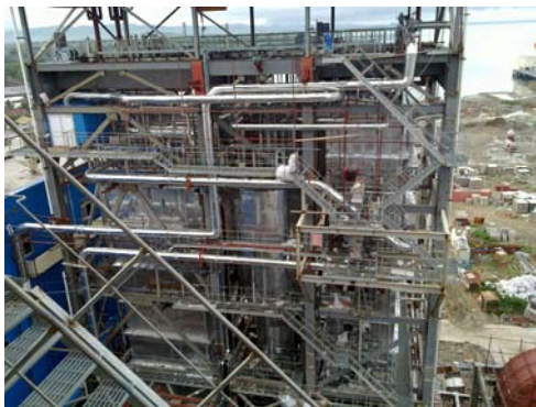
苏拉威西项目现场

2011 年 10 月，中能公司承接印度尼西亚苏拉威西 2×220t+2×50MW 机组调试项目的技术服务，派遣由锅炉、汽机、热工专业组成的调试技术服务组，赴印尼苏拉威西工地。