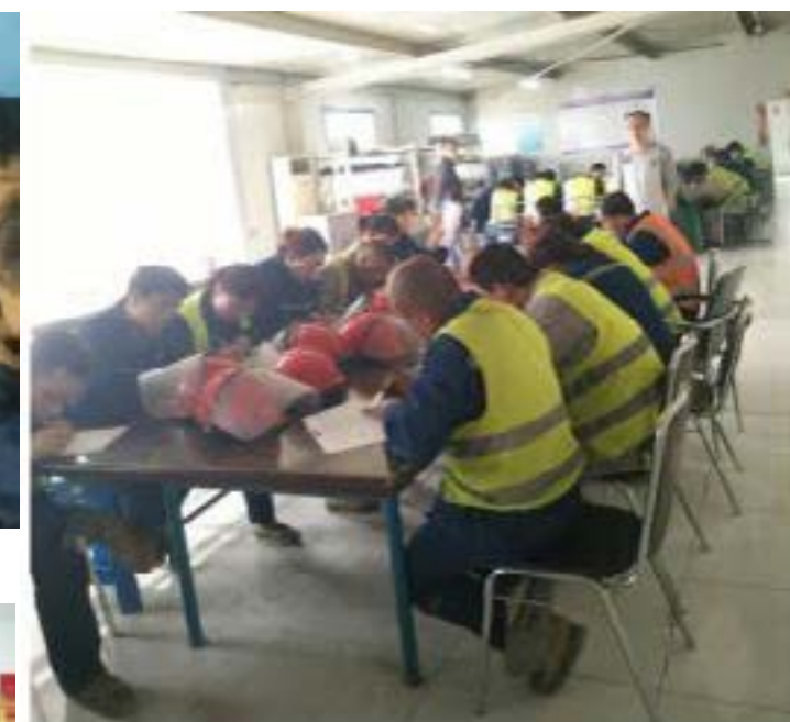
中电投原平项目部