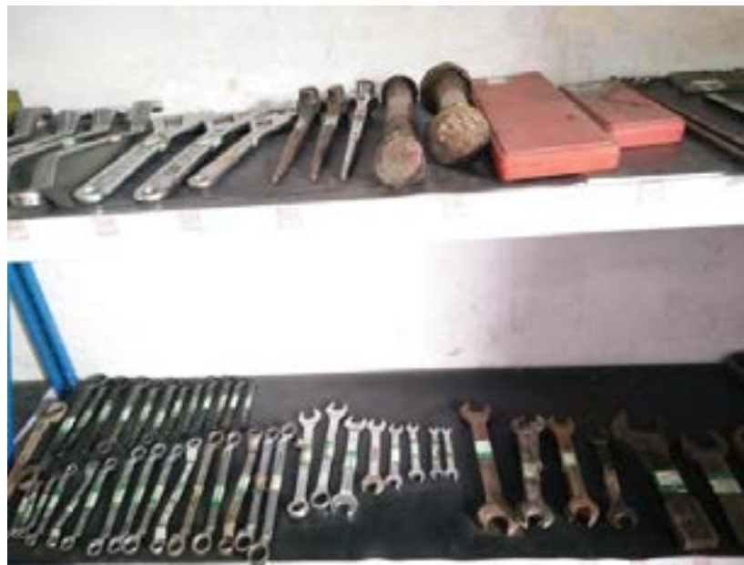
项目部工器具管理