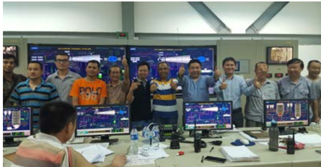
印尼 BBL 项目部分员工合影

机组一次并网成功为机组下一步通过360小时试运行打下了坚实的基础。目前，我司各专业人员已经投入下一步工作的准备中，积极备战，再接再厉，为中能再添绚丽色彩。