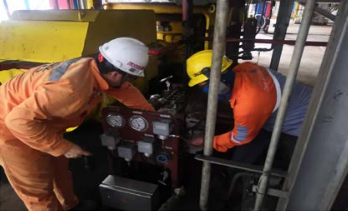
《中能人》第 174 期 第 6 版