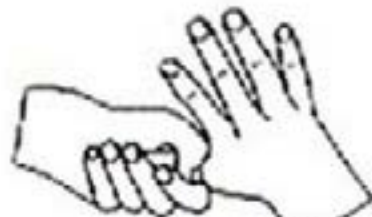
5. 拇指在长中转动搓擦