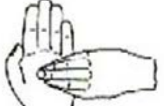
6. 指尖在掌心中搓擦