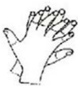
2. 手指交错掌心对手背搓擦