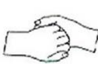
4. 两手互握互搓指背