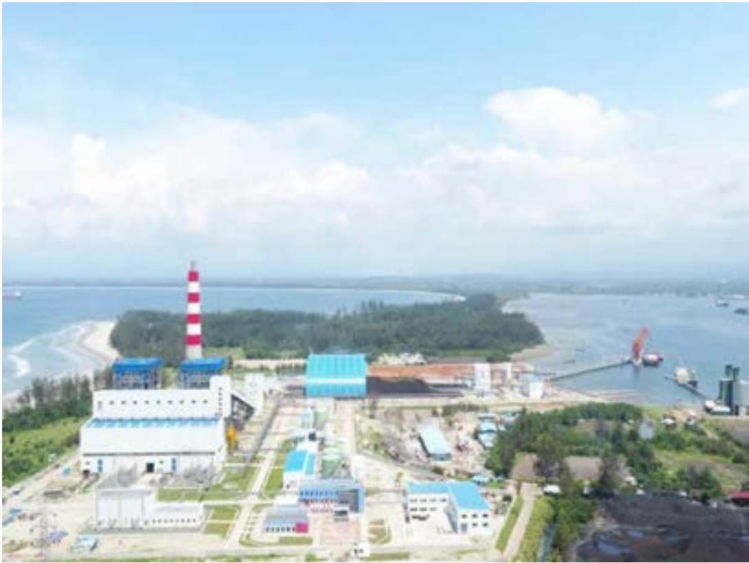
《中能人》第 174 期 第 5 版

中能调试团队始终秉持“客户为要，诚信负责”的理念，精心准备，严密组织，严谨操作，及时消缺，克服了煤质变化大等诸多困难，确保了机组运行稳定，各项技术指标优良，如期高质量完成机组调试任务。