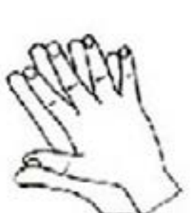
3. 手指交错掌心对掌心搓擦