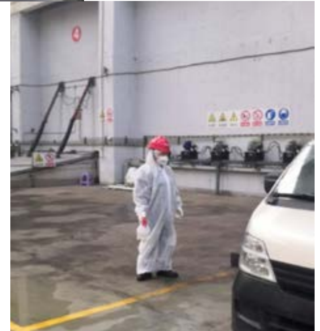
▼项目部员工进出现场需穿防护服