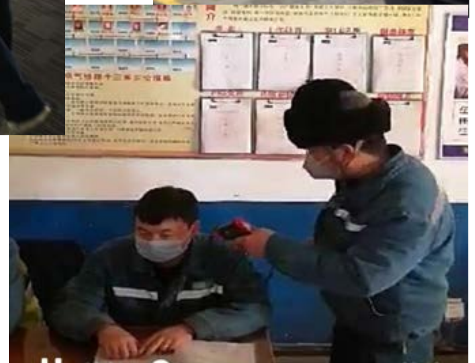
▶每日给员工测量体温至少两次