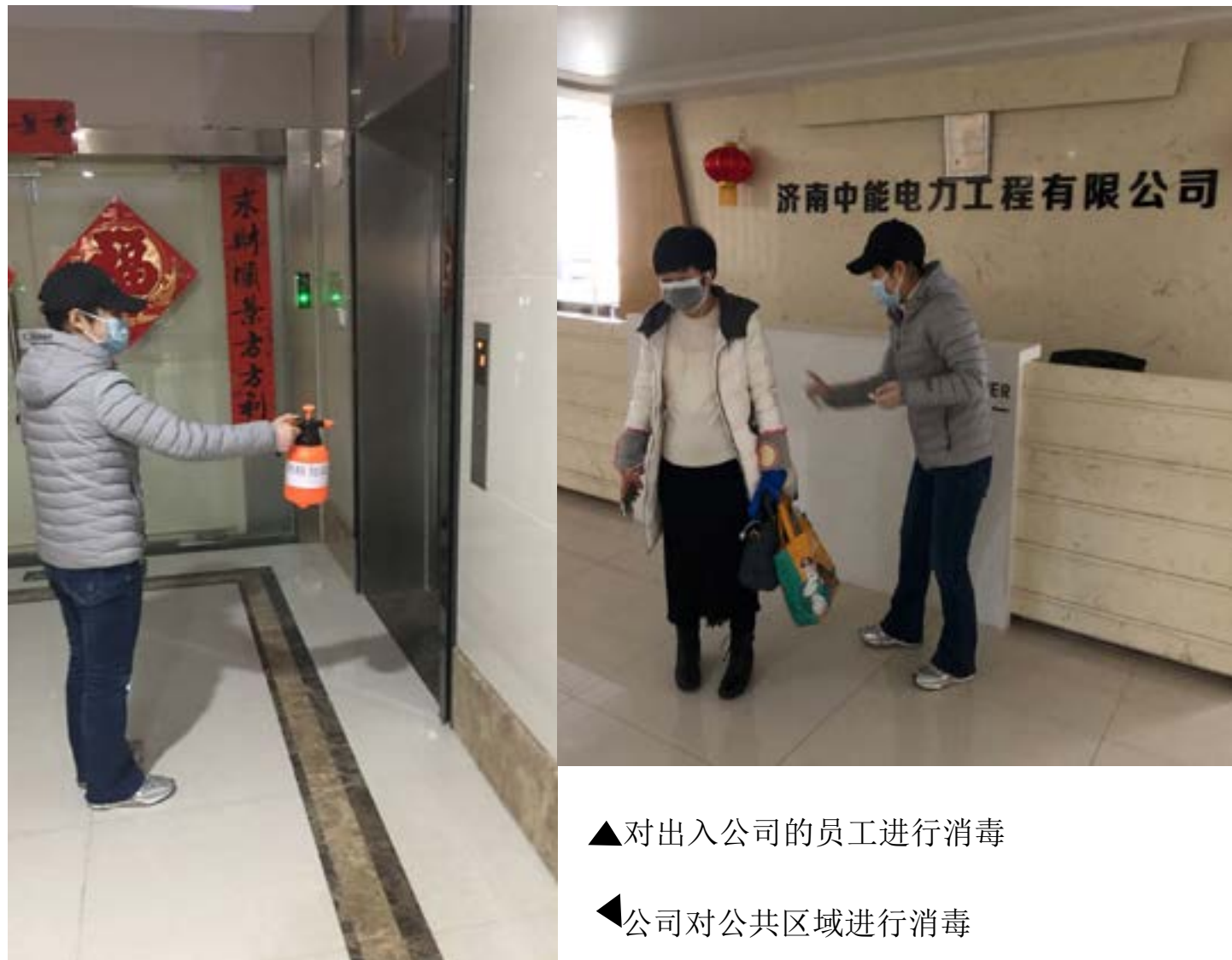
▲对出入公司的员工进行消毒

近日来，公司采取的各项疫情防控措施，进一步保障了公司安全稳定运转和员工的生命安全、身体健康。