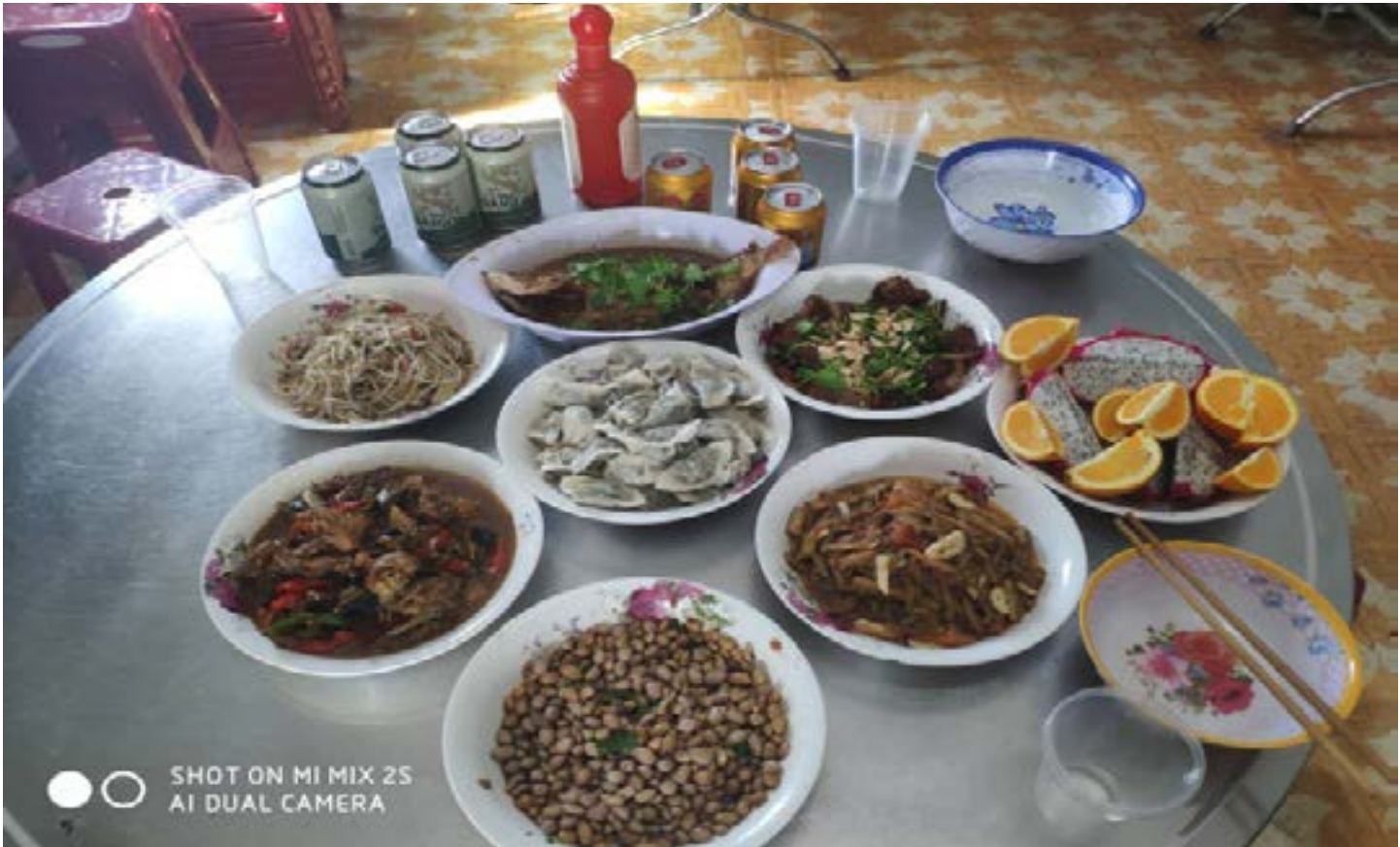
《中能人》第 173 期 第 11 版

在这个特殊时期，原平项目部始终保持着较好的出勤率、消缺率，各项疫情管控措施得当有力， 各项疫情管控数据准确无误，得到了业主方的高度赞扬。