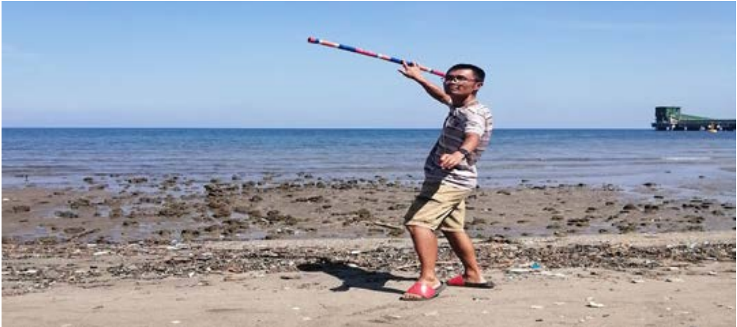
《中能人》第 173 期 第 12 版

起初来源：2019 年，在公司领导的安排下，有幸来到了菲律宾 K 厂项目部，入住项目营地生活区；经过一段时间的工作与生活发现，生活区后门口便是大海，附近有居民，每天早上都有渔民打鱼归来的场景，有时还能看到当地的一些其它生活习俗，这一切吸引了我的注意；于是，每天早上都早起一个多小时去欣赏一下这里的美景，感觉真是美好。