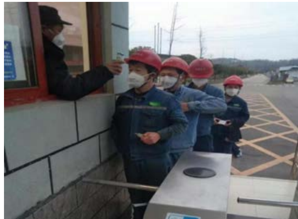
◀每日出入电厂为员工测量体温