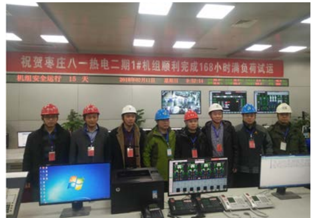
各参建单位人员合影