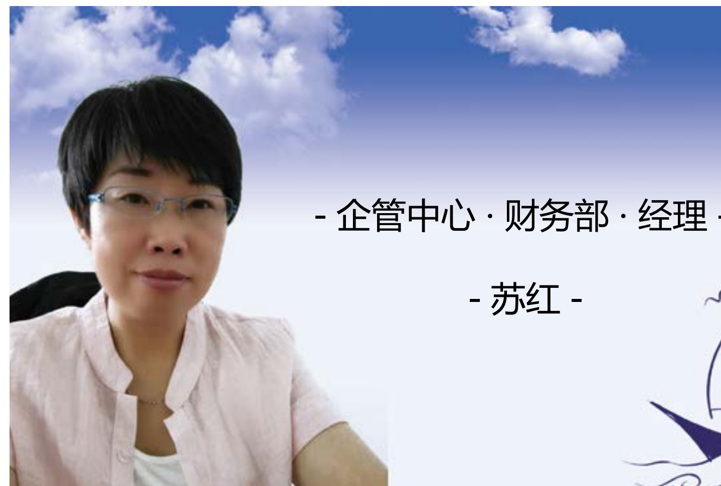
- 企管中心·财务部·经理 -