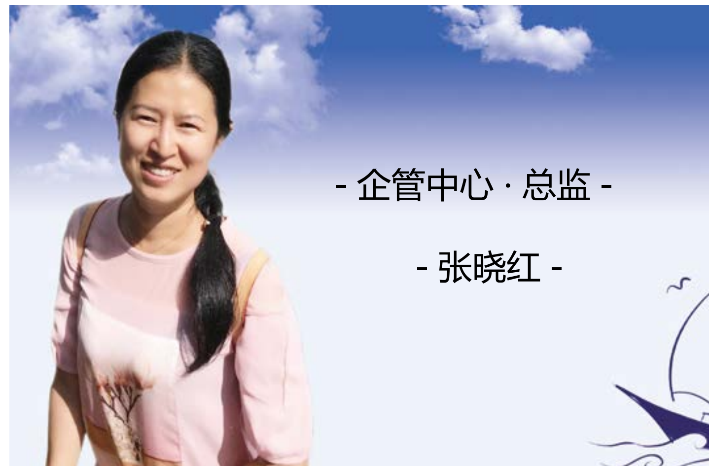
- 企管中心·总监 -