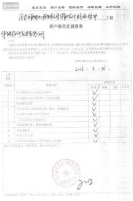
客户满意度调查表

2016 年 6 月，中能电力收到华能临沂发电有限公司反馈的第二季度客户满意度调查表，调查表显示，中能电力在履约质量、技术水平、服务态度等方面均受到全优好评。这是继第一季度得到全优反馈后，业主对中能电力的又一次肯定。 中能运维团队自 2013 年 12 月进驻华能临沂电厂至今已有 2 年时间，始终坚持“诚信负责，客户为要”的宗旨服务于业主，坚持“高标准、严要求”的工作方式回报业主，得到业主持续好评。此份满意度调查反馈显示，华能临沂电厂对我司临沂运维项目团队的履约质量、服务态度、专业技术水平等方面表示满意，对各考核项给予全优反馈。 此调查表是业主对中能电力的肯定，更是公司前进的鞭策和动力，中能将以更高的履约质量和更完美的服务回报业主的信任。