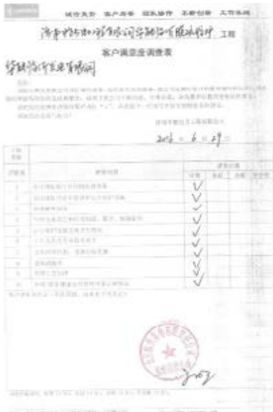
客户满意度调查表

2016 年 6 月，济南中能电力工程有限公司喜迁新址，入驻济南市历下区鲁商·盛景广场 B 座 7 层。 中能电力成立于 2003 年，13 年的历程，有过曲折，但始终在努力发展，2016 年 6 月，顺应公司现阶段的发展需求，经过各部门为期近一年的准备，中能电力公司迁入新址历下区鲁商·盛景广场 B 座 7 层。新职场面积约为 1200 平米，设计与装修采用现代化办公理念，在公共职场采用开放式布局，敞开式办公，以方便各部门工作交流。在办公家具的选择上，充分考虑职场光线、人体工程学、员工的人口特征和喜好、注重家具的环保和质感，力求给员工舒适的办公环境；在关键区域如公司前台、VIP、会议室，在现代风格中融入中式元素，使得整体风格沉稳大气。公司专门配备会议室 2 间，可同时容纳 70 人参会，配备接待室 2 间，以接待客户、业主来访，仓库 1 间、设备间 2 间，以便物料、劳保用品和设备器材的整理与发放，同时为员工配备生活区，可供员工就餐、运动、休闲，舒适的办公、生活环境，是中能企业文化“工作乐趣”的体现。 此次乔迁，不仅给员工创造了良好的工作环境，更是公司有信心、有实力的标志，同时也见证了公司近年来的良好发展势头。公司将继续努力，创造更加辉煌的明天！