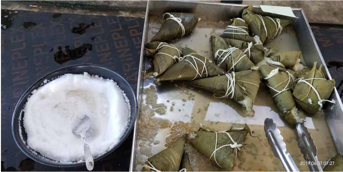
菲律宾 K 厂项目

端午节是中华民族的传统节日。俗话说“每逢佳节倍思亲”，对家乡和亲人的思念是人之常情。中能的同事们由于大部分在项目上工作，目前正值各项目工作全面发展的时期，他们无法陪伴在家人身边。为了让兄弟姐妹们身在异乡感受到家的温暖，在项目上也能过一个温馨祥和的节日，总部综合部早早就行动起来，为各项目部同事采购了香甜的粽子，在节日期间送到了各个项目部。让每位员工从这种传统的节日美食当中感受到公司的关怀。海外项目部的同事们远在异国他乡，他们也在各项目经理的带领下，采用各种形式度过佳节。聚餐、烧烤，再来一个小节目。即便身在天南海北，大家的心也始终在一处。