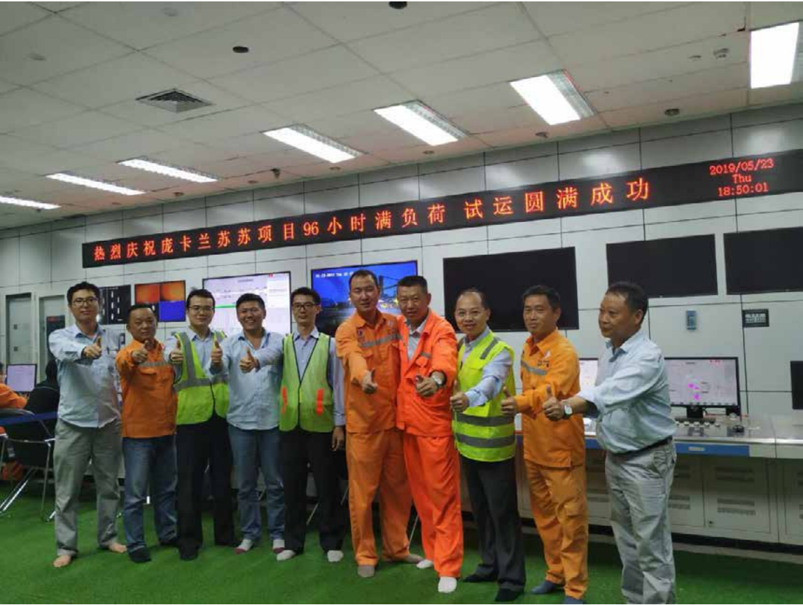
中电投德阳调试项目获业主表彰

工作任务重。项目的每个中能人在工作中，努力践行习总书记提出的“撸起袖子加油干”思想，努力想办法、战困难、重创新、展实力，顺利完成了每个节点同时也展现了中能人的形象。