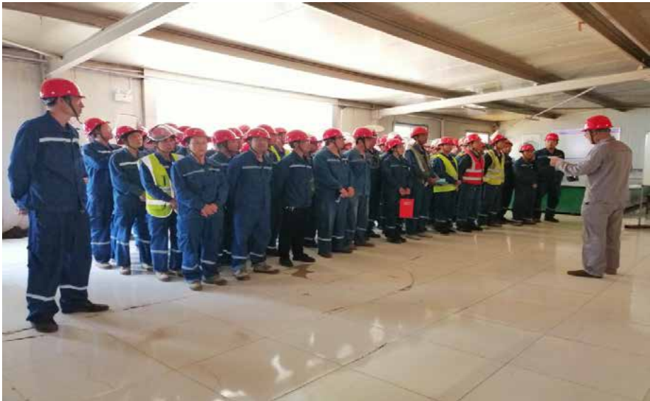
《中能人》第 165 期 第 7 版

2019 年 6 月 21 日，济南中能原平项目部举行了主题为“苦干实干 100 天，降本增效比贡献”，向 70 周年国庆献礼动员大会，其目的是动员全体职工统一思想，鼓足干劲保质保量完成检修维护任务，全力保障设备正常运行。项目部领导班子、各班组负责人及部分一线员工参加了此次活动，大会对活动内容进行了宣贯，对各项工作提出了明确要求。