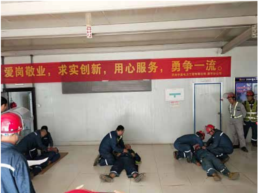
《中能人》第 165 期 第 8 版

此次动员大会以安全知识竞赛颁奖活动为契机，明确了下一步工作任务，鼓舞了员工的士气，激发了全体员工的工作热情，为全面开展“苦干实干 100 天，降本增效比贡献”活动奠定了坚实的基础。