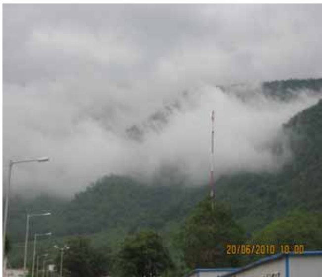
优秀奖《印度风景》作者李兆东