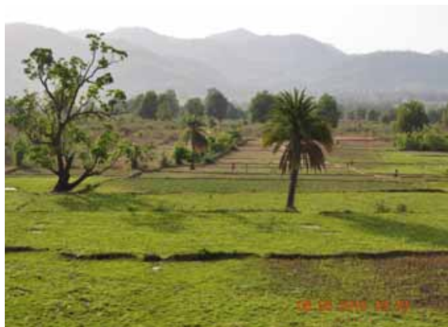
优秀奖《印度特色景物照一组》作者吴冰