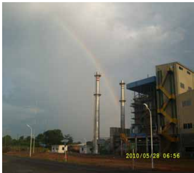
二等奖《不经历风雨，怎能见彩虹》作者孙文博