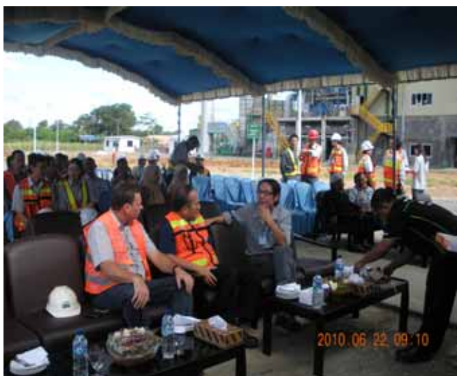
二等奖《下午三点的午餐与上午九点的水果点心》作者董平