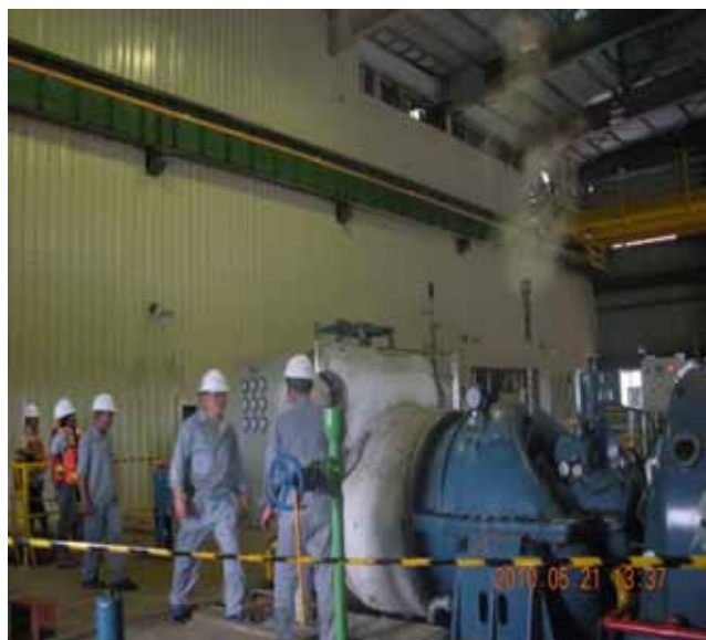
三等奖《印尼现场工作照一组》作者刘治国