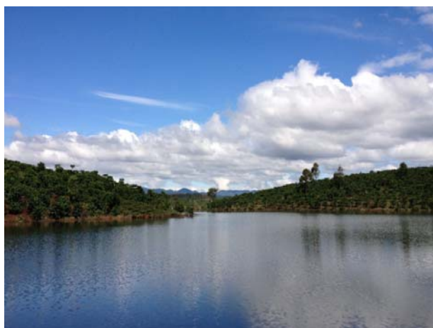
蔚蓝不带任何杂质的天空