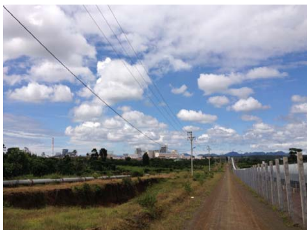
隐约可见的电厂烟囱