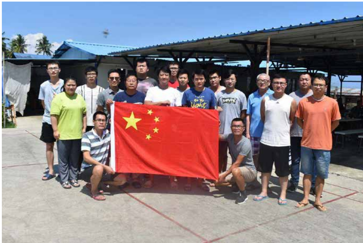
苏苏项目、菲律宾项目祝全体中能人节日快乐