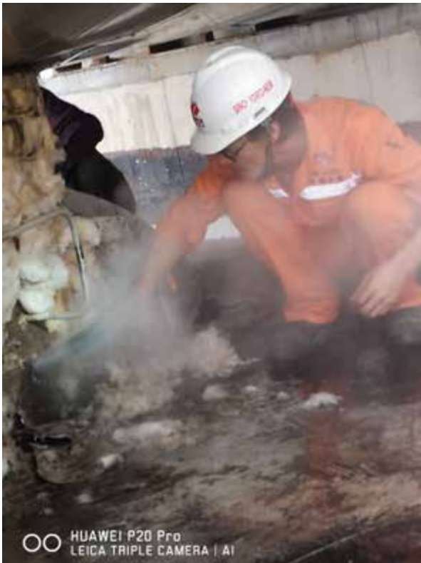
除氧器下降管处理过程