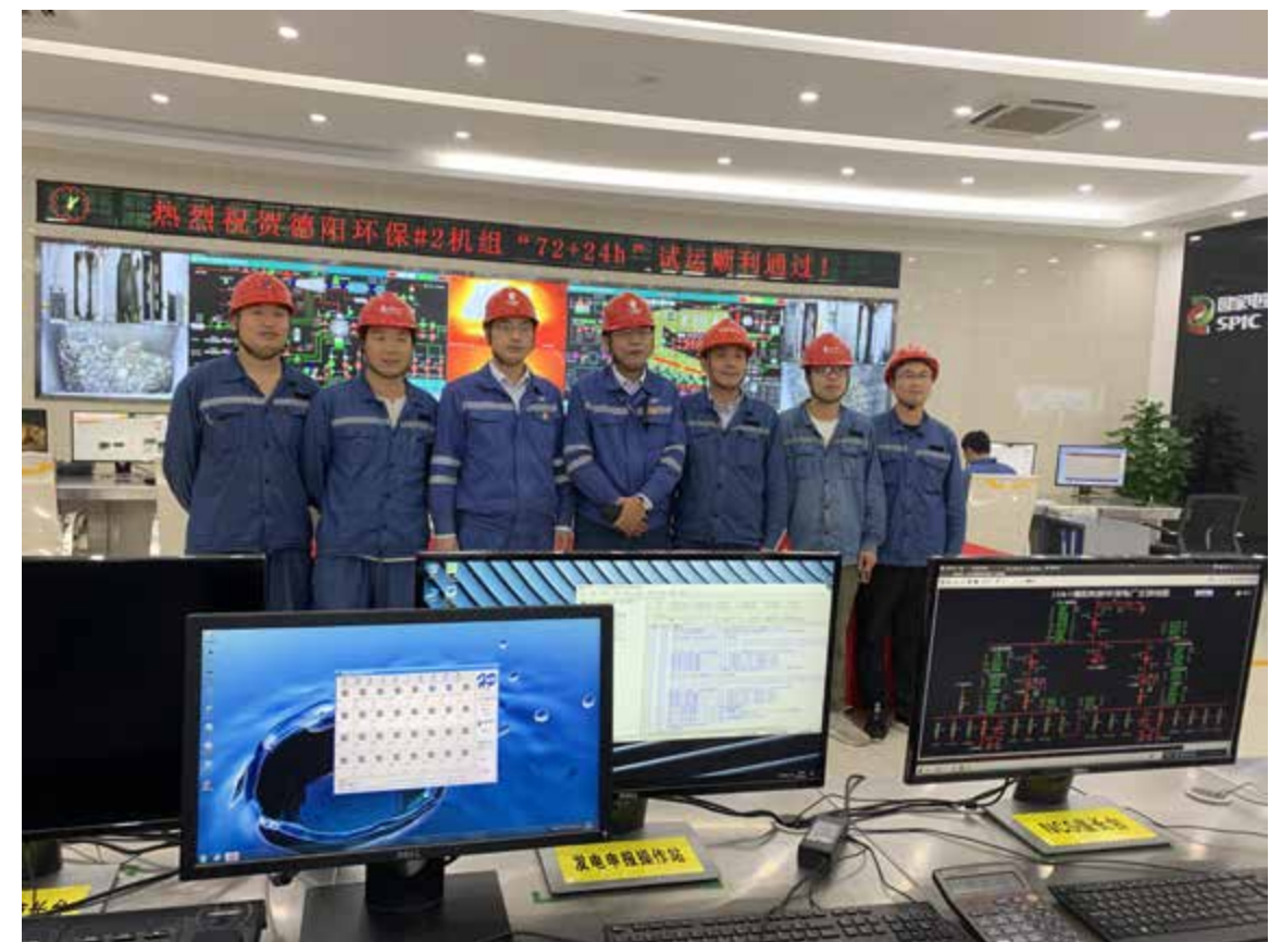
#2 机组“72+24”试运顺利通过

项目取得如此成绩离不开每一位项目人员的辛勤付出，此荣誉属于属于德阳项目全体人员，更属于全体中能人，在赢得业主方尊重的同时成就自我，为公司赢得更多的声誉和佳绩。