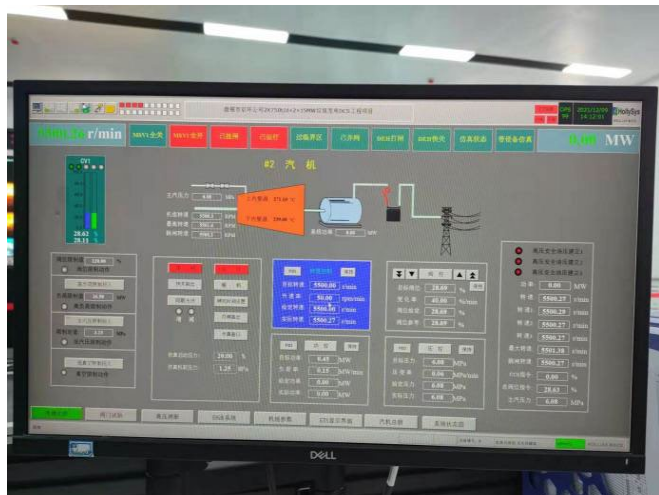
2# 汽轮机定速 5500r/min

自12月08日，2#机组整套启动以来，试运指挥部超前策划，科学组织，精心调试，全体员工凝心聚力、不断促进现场各项工作推进，坚持每日召开调试会，对各项调试工作进行部署；机组试运以来，统筹策划、多措施消除各项缺陷，不断细化并网各项准备工作；进入整套启动阶段后，合理安排各参建单位的白班和夜班值班人员，对锅炉、汽机房等进行区域划分，建立专业人员、调试人员、安全及保卫人员等三级巡视制度和整启巡视报告制度，为机组并网发电打下了坚实基础。