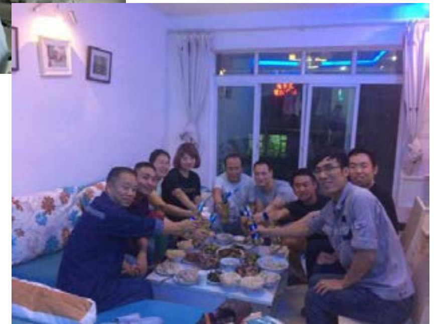
花溪项目欢乐合影 ▶