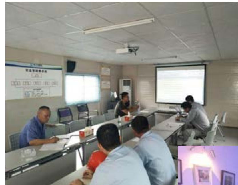
◀永州项目调试方案会审

通过这次走访，增强了团队的凝聚力和员工的归属感，公司领导听取了员工的心声和建议，为大家进一步营造更加宽松的工作环境，优化管理。同时也希望所有中能人能再接再厉，为我司做出更大的贡献。